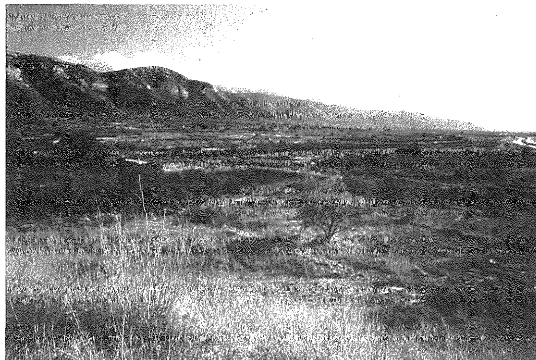
* Museu del Montsià. Informatiu núm. 38, abril 1996

Després d'unes dècades d'abandonament, l'excursionisme primer, les entitats conservacionistes després, el recent i el renovat interès dels municipis, després de la seva inclusió en el Pla d'Espais d'Interès Natural de Catalunya, i la voluntat d'aglutinar esforços del Consell Comarcal, impulsant la redacció del Pla Especial han fet que per la Serra torne a estar en el centre d'interès per a la població que s'estén als seus peus.